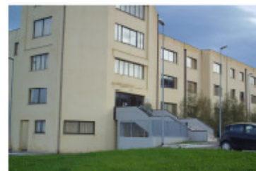
Sezione staccata di Rodi Garganico