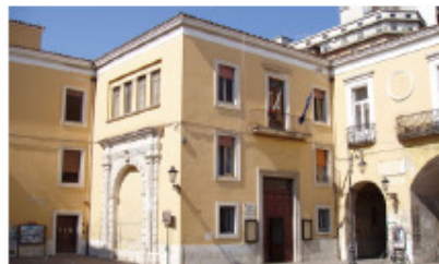
Sede di Foggia

CONSERVATORIO DI MUSICA Umberto Giordano